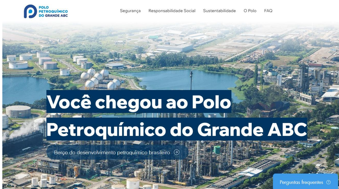
Imagem 1: Página inicial do projeto de site para o Polo Petroquímico do ABC

Foram apresentados alguns pontos principais do site, que conta com página inicial com menu enxuto (Segurança, Responsabilidade Social, Sustentabilidade, O Polo, e FAQ), principais informações em destaque, presença de botões que redirecionam para as páginas com mais informações, textos mais objetivos e um botão fixado na tela do usuário que remete à página “Perguntas Frequentes” (FAQ) – que aparece como um recurso útil e prático para responder aos principais questionamentos sobre o Polo.