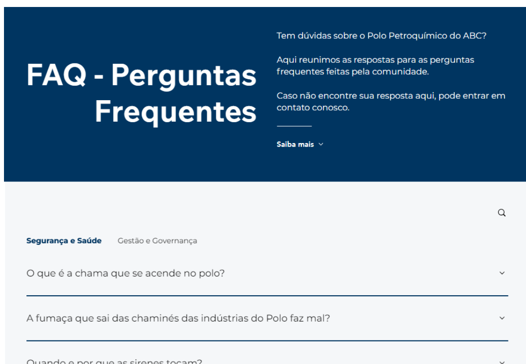
Imagem 2: Recorte da página “Perguntas Frequentes (FAQ)”